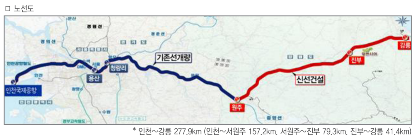
[참고1] 기존선 개량 및 고속화 노선도