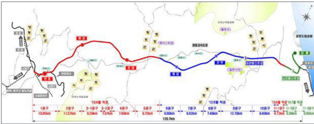
[참고2-3] 사업개요 : 원주~강릉 철도건설사업