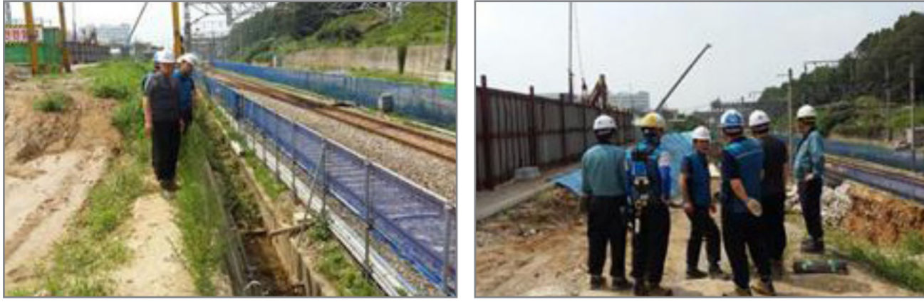
〈운행선 인접공사 안전점검 시행〉