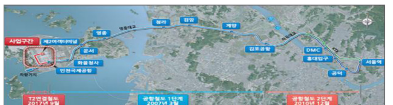
[참고2-1] 사업개요 : 인천공항 제2여객터미널 연결철도 건설사업