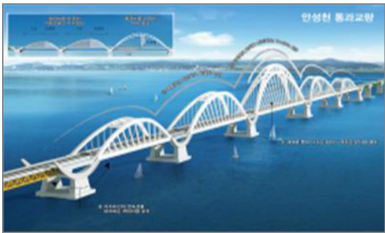
〈붙임〉 아산(평택)호 통과 명품교량 (L=5,900m)

본부 관계자는 “아산(평택)호 통과 교량공사를 시작으로 서해선 전 구간 주요구조물(교량, 터널)공사를 순차적으로 착공하여 2020년까지 완공할 계획”이라고 전했다.