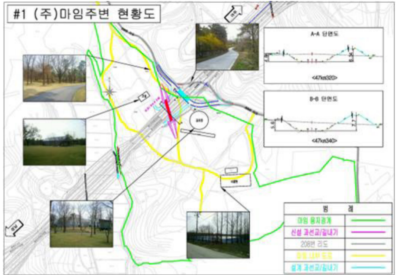
<마임비전 빌리지 전경 및 철도노선>

*경기도 여주시 능서면 용은리 일원에 조성한 휴양시설로서 평소 각 기업체의 연수, 드라마(시크릿가든 등) 및 영화촬영 장소로 활용 시설