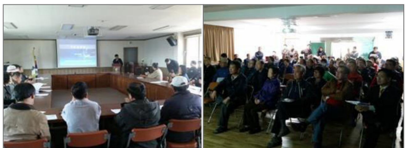
'15. 3. 24. 10:00 ~ 소요동 주민센터

수도권본부는 이 구간의 공사가 지연될 경우 수도권 전철을 이전시키지만 운행할 수 밖에 없는 실정이며, 최대 피