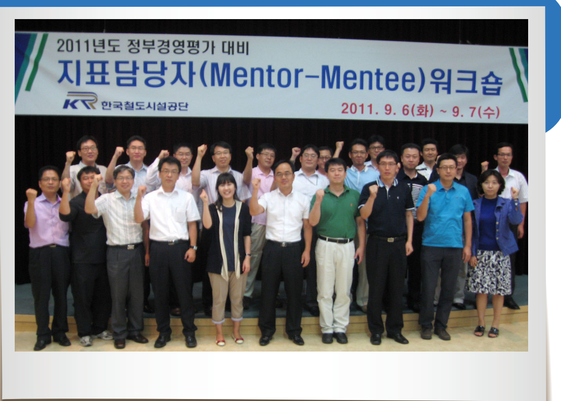
표관리로 다시 공단을 정부경영평가 A등급 기관으로 도약시키자고 격려했다.

이를 통한 워크숍을 주관한 성과관리처장은 워크숍에 참석한 전직 및 현직 워크숍 담당자들에게 감사사를 표하고, 올해는 철저한 지