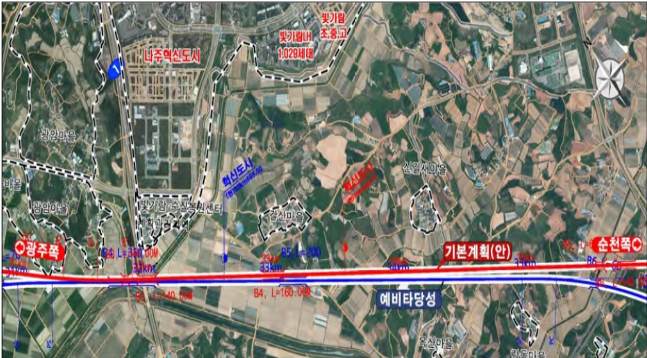
전라남도 나주시 금천면 월산리 일원