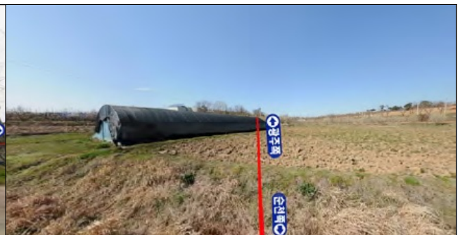
혁신도시 정거장 #2