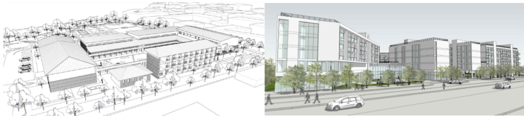
랜더링하지 않은 3차원 이미지의 참고 사례