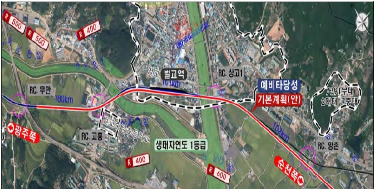
전라남도 보성군 별교읍 별교리 일원