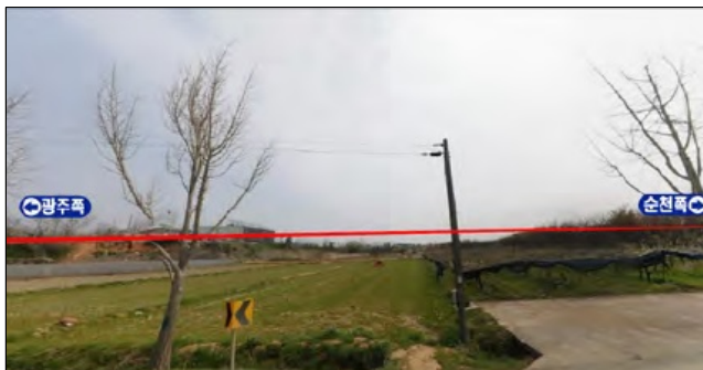
혁신도시 정거장 #1