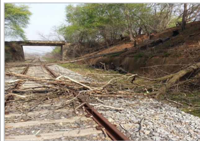
(수목 제거 및 제초 작업 전 사진)

□ DMZ 남북관리지역 내 철로변 수목 제거 및 제초 작업(L=1,872m, B=8m)