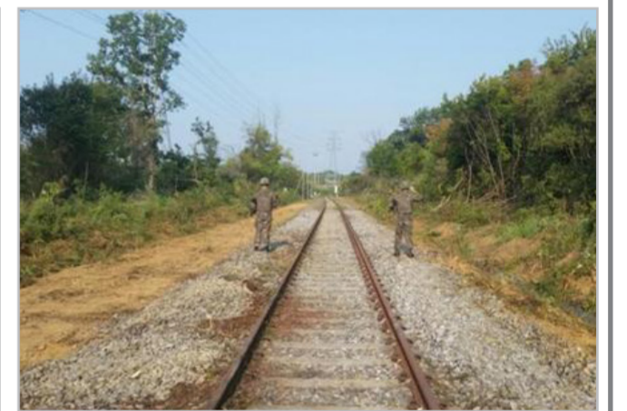
(수목 제거 및 제초 작업 완료 사진)