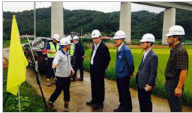
현장 현안사항 점검