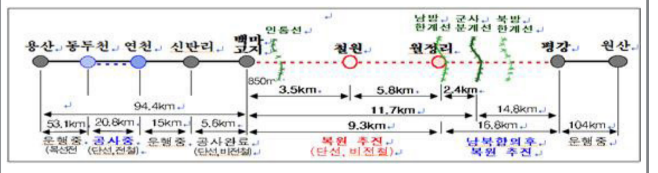
[참고] 경원선 철도복원 노선약도

본부 관계자는 “경원선 복원에 따른 월정리역사 건설로 강원북부지역 접근성이 크게 향상되어 신규 관광 인프라 구축 및 지역 경제발전에 기여할 수 있을 것으로 기대된다”고 밝혔다.