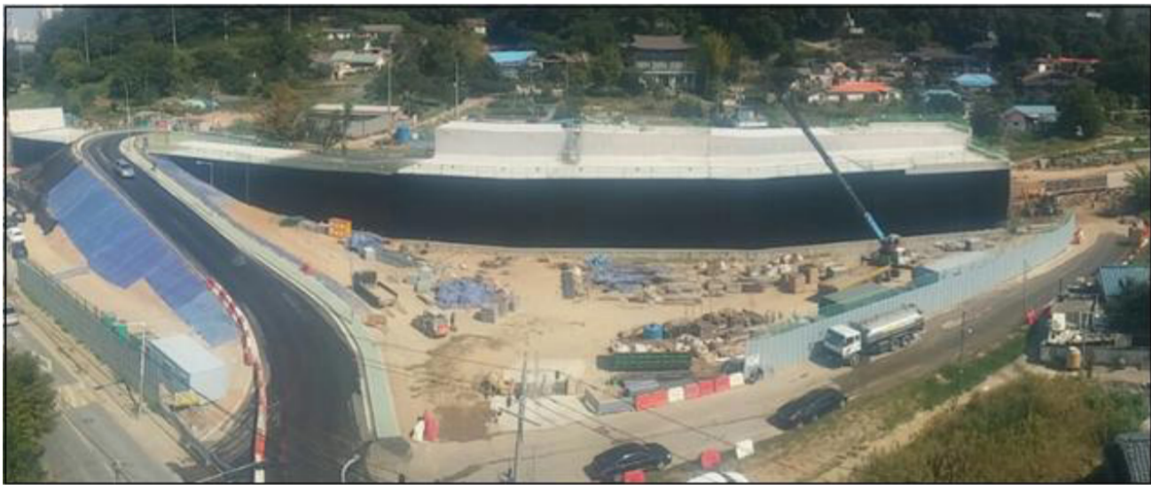
[참고] 옥골구역 철도덮개구조물 현황사진

본부 관계자는 “이로써 지역주민의 편의 및 송도역세권 도시개발에 박차를 가하여 지역발전에 이바지할 수 있을 것으로 기대된다”며 “내년초 수인선 개통을 위해 노반, 궤도, 시스템분야 등 잔여 공사를 안전시공하여 적기에 공사가 마무리될 수 있도록 최선을 다하겠다”고 밝혔다.