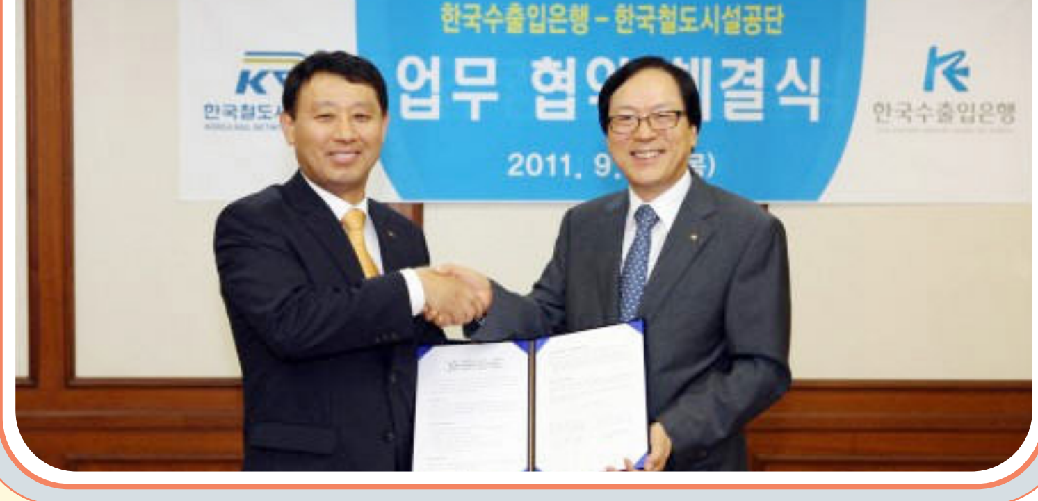
한국수출입은행-한국철도시설공단 업무협약 체결식 (2011. 9. 15)