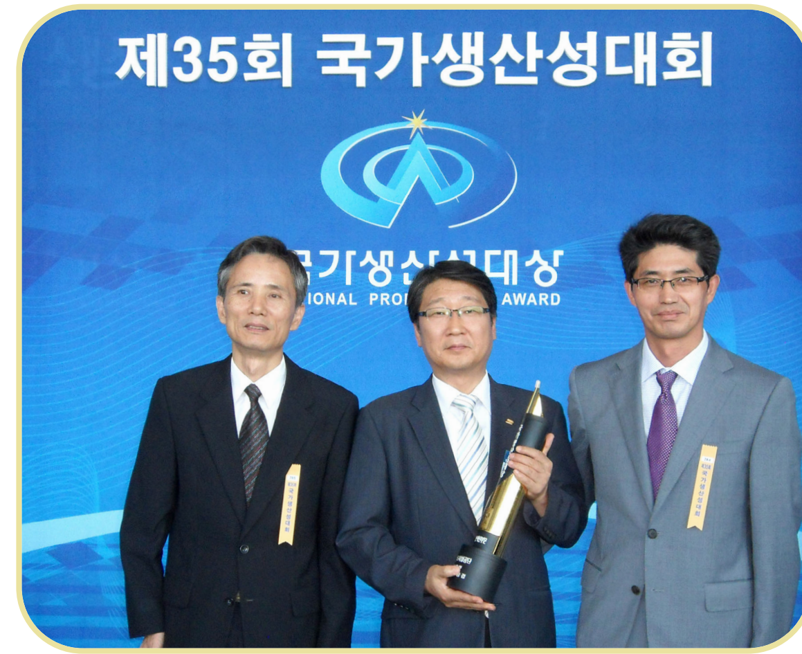
<품질안전단 민광식 기자>

공단은 금번 국가생산성대상 수상을 통하여 얻은 효율적 경영에 대한 객관적 평가와 국민적 관심을 지속적인 성과창출 극대화에 임직원의 혁신의지와 근로의욕을 집중시키는 계기로 삼을 계획이다.