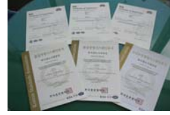
ISO 9001/14001, K-OHSMS 18001 국제/국내인증서

또한 품질·환경·안전 보증체계의 적정성을 확보함으로써 국민에게 보다 안전하고 편리한 명품철도를 제공하여 국가비전에 맞는 대표적 미래교통수단으로 철도의 가치를 새롭게 평가하고 재창조해 나갈 계획이다. (연구원 정재형 기자)