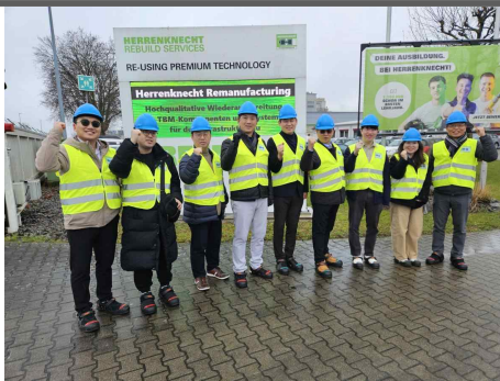
헤렌크네히트社 재제조공장 방문