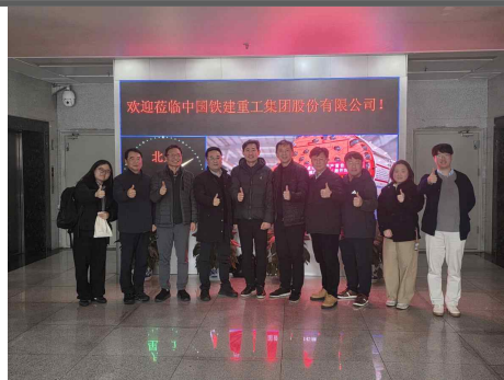
중국 CRCHI社 본사 방문