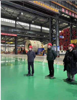
중국 CRCHI社 제조공장 방문