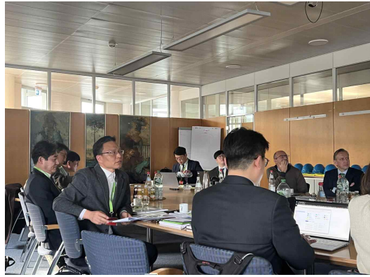
헤렌크네히트社 본사 방문